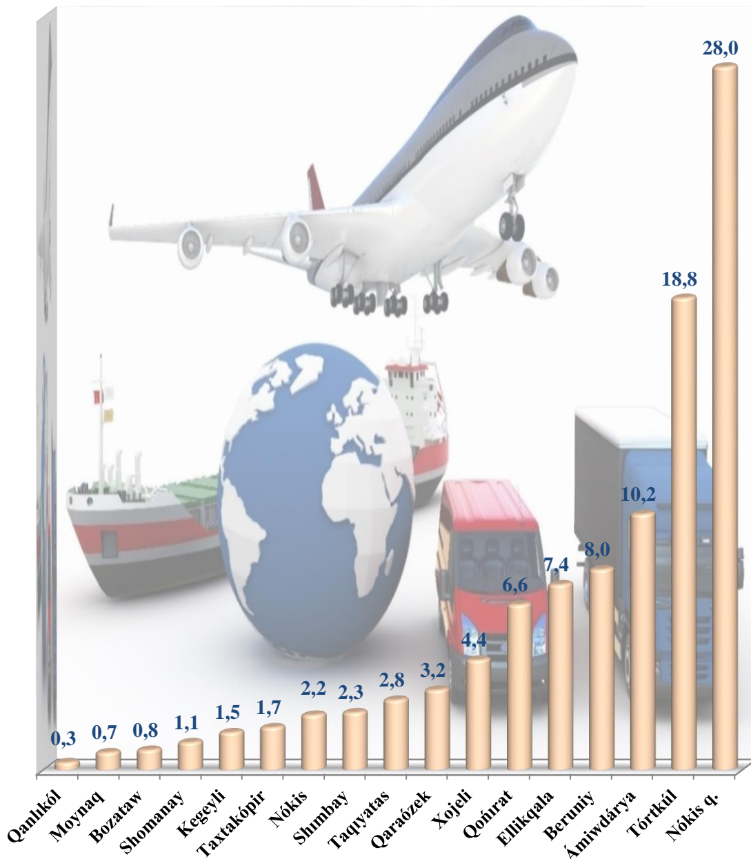
Tasilǵan júk aylanbasınıń ulıwma kóleminde aymaqlardıń úlesi, % te (2024-jıl yanvar-mart)

Aymaqlar boyınsha tasilǵan júk aylanbasınıń joqarı úlesi boyınsha jetekshi orındı Nókis qalası (28,0 %) iyeledi. Sonıń menen birge, Tórtkúl (18,8 %) hám Ámiwdárya (10,2 %) rayonlarında gúzetildi.