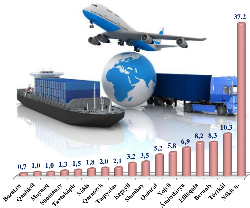
Tasılǵan jolawshınıń ulıwma kólemde rayonlardıń úlesi, % te (2024-jil yanvar-mart)

Qala hám rayonlar kesiminde jolawshı tasıw boyınsha joqarı úlesti Nókis (37,2 %) qalası iyeledi. Sonıń menen birge Tórtkúl (10,3 %) hám Beruniy (8,3 %) rayonlarında gúzetildi.